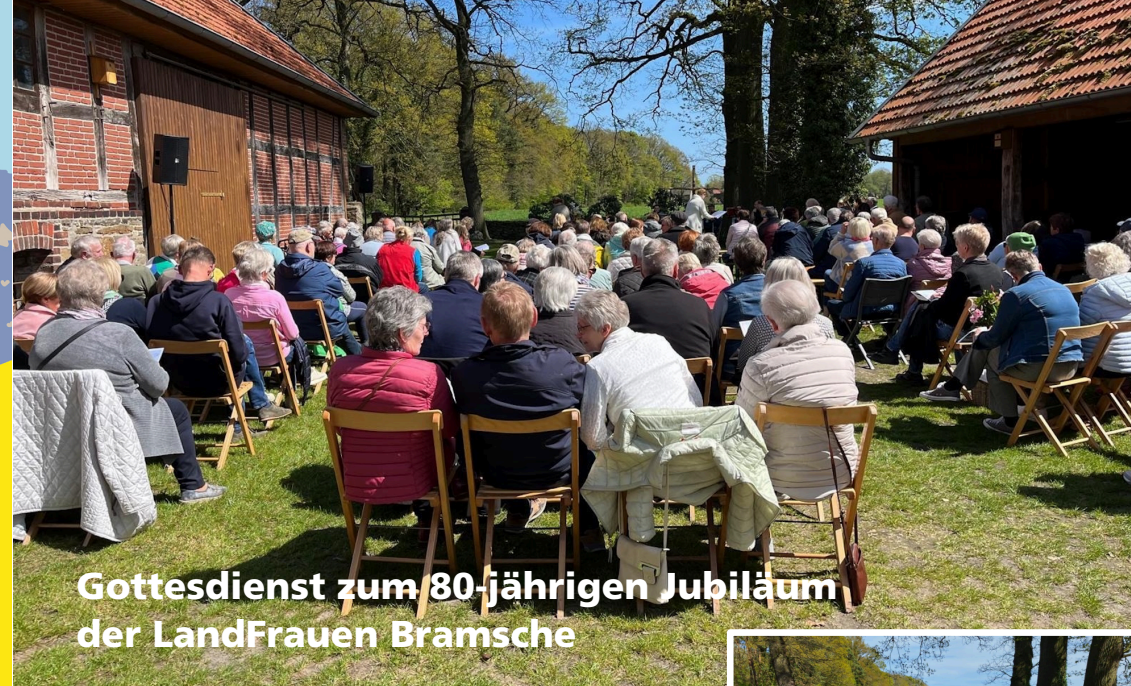
Gottesdienst zum 80-jährigen Jubiläum der LandFrauen Bramsche