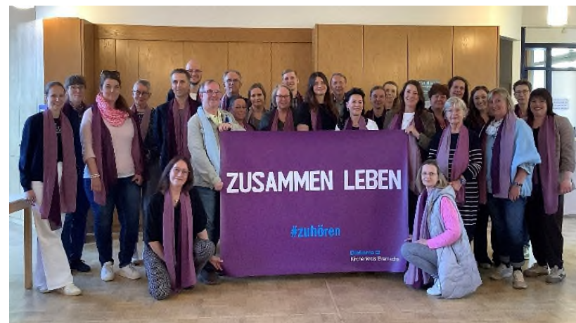
Auftaktveranstaltung zur Woche der Diakonie am 29.04.2026